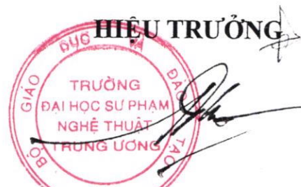
PGS.TS. Đào Đăng Phượng